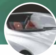
▶ Película para Vidros